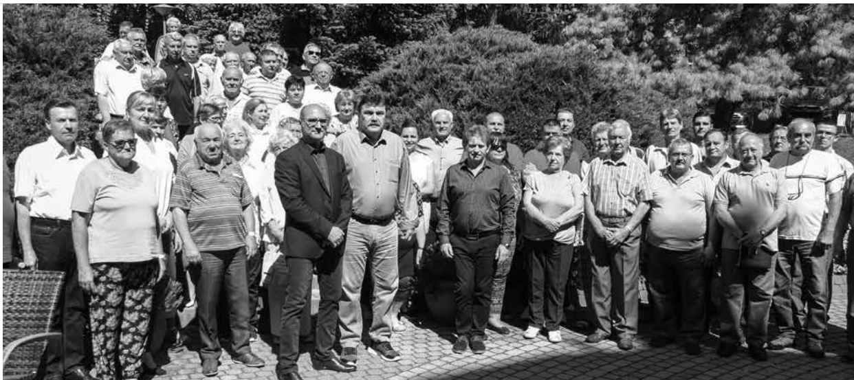
A BDSZ hagyományaihoz híven ebben az évben is sor került a BDSZ alapszervezeteinek képviselőiben választott titkárok országos találkozájára Balatongyörökön. Az aktív és nyugdíjas szakszervezeti tagokat mintegy száz fő képviselte a három napos rendezvényen.

Annyiban talán mégsem volt hagyományos ez a rendezvény, hogy alig egy hónappal később rendezték meg, mint a 2022. évi magyarországi parlamenti választásokat.