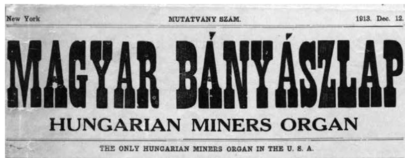
Az első szám fejléce

(H. M.) Mint annyi más magyar, e sorok írója is jobb hazát jött keresni s mint annyi más újonnan érkezett bevándorolt, kinek kézműves mestersége nincs, e sorok írója is a fekete gyémántok sötét birodalmában, magyarosan a szénbányában kezdte amerikai pályafutását.